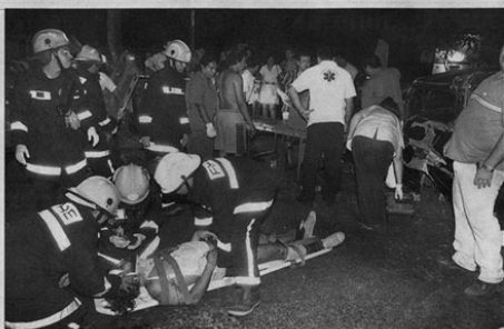
Los accidentes de tránsito son una constante no solo en Paraguay, sino en Iberoamérica, por lo que especialistas buscan un mecanismo de prevención eficaz. (Foto de archivo).